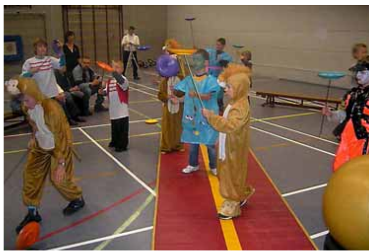
Oefenen voor de voorstelling in Alphen.