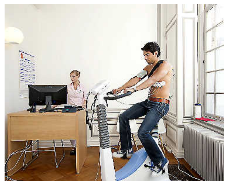
Kliniek in het Voorschotense landhuis Ter Wadding.

zorg melden voor een screening, heeft De Grooth nog nauwelijks gezien. „Die belangstelling is minimaal. Er is één patiënt geweest die zonder verwijzing van de huisarts hier kwam.”